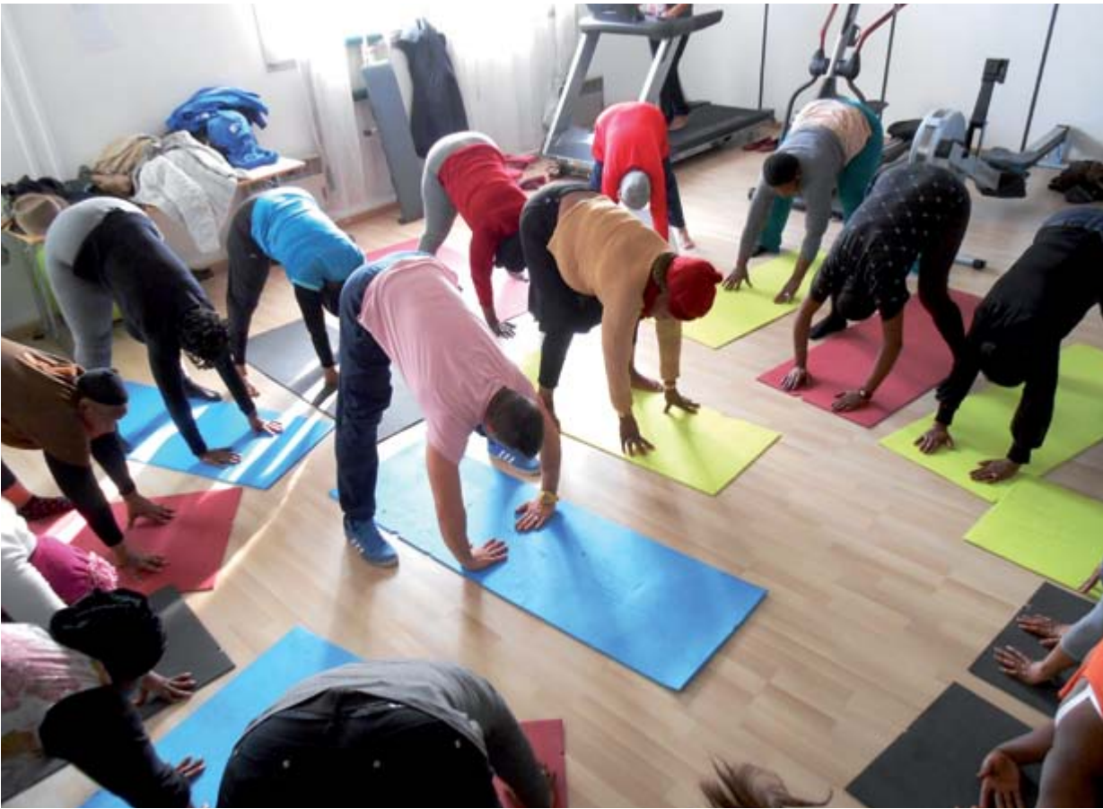
Séance collective de gymnastique à l'association Ikambere.

Et puis, nous alternons. L'idée est qu'elles parviennent à s'approprier leur corps de nouveau.