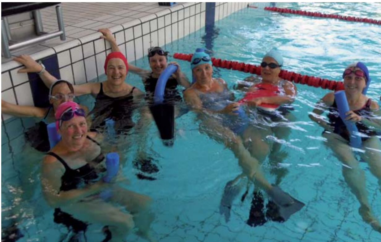
Groupe Saphyr natation, club des nageurs d'Épinal.