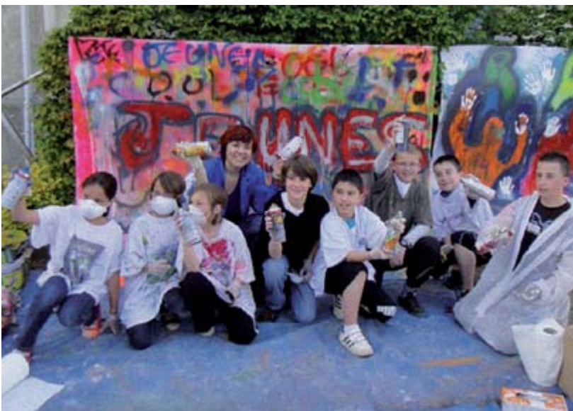
Activités culturelles et de loisirs proposées par Fabrik'Anim' pour recréer du lien social.

Le dispositif présenté ici a été primé dans le cadre du concours de l'Agence pour l'éducation par le sport (Apels) intitulé « Fais-nous rêver ». Créé en 1997, il est ouvert à toutes les associations (sportives, de jeunesse, d'éducation populaire, de solidarité, d'insertion, etc.) porteuses de projets socialement innovants construits autour du sport. Il permet d'identifier et de diffuser les bonnes pratiques en matière d'éducation par le sport. Certaines des initiatives, qui font l'objet d'un article dans ce dossier, ont été identifiées par le biais de ce concours.