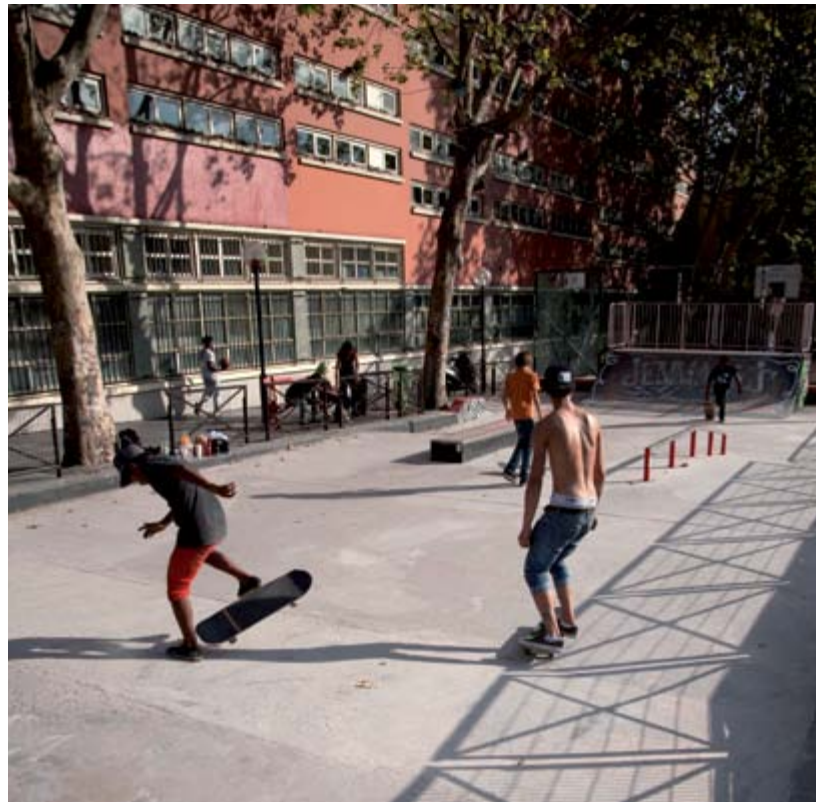
Quartier du canal Saint-Martin, Paris.

« LES JEUNES DOIVENT ÊTRE BIEN DANS LEUR CLUB. C'EST AUSSI UN LIEU OÙ IL Y A DE LA CONVIVIALITÉ, DES ÉCHANGES, DES RENCONTRES... »