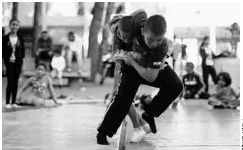
Animation sur le plateau sportif du quartier des Moulins, Nice.