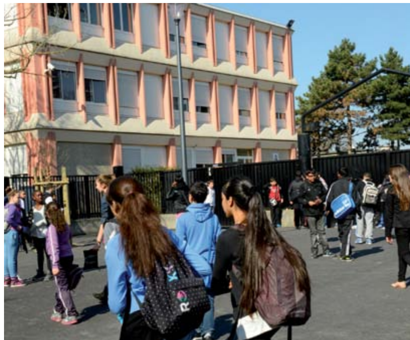
Collège République de Bobigny.