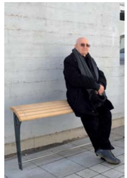
Banc assis-debout à Besançon, exemple de mobilier urbain pensé pour les seniors.

Mais l'aménagement des rues pour encourager le déplacement ne suffit pas toujours à faire sortir les personnes âgées de leur domicile. Certaines ont besoin d'être accompagnées. C'est ce que font les bénévoles de la Maison des seniors, une quarantaine de retraités et de personnes en activité ainsi que des jeunes en service civique. C'est pourquoi développer le lien social est un axe fort de notre politique.