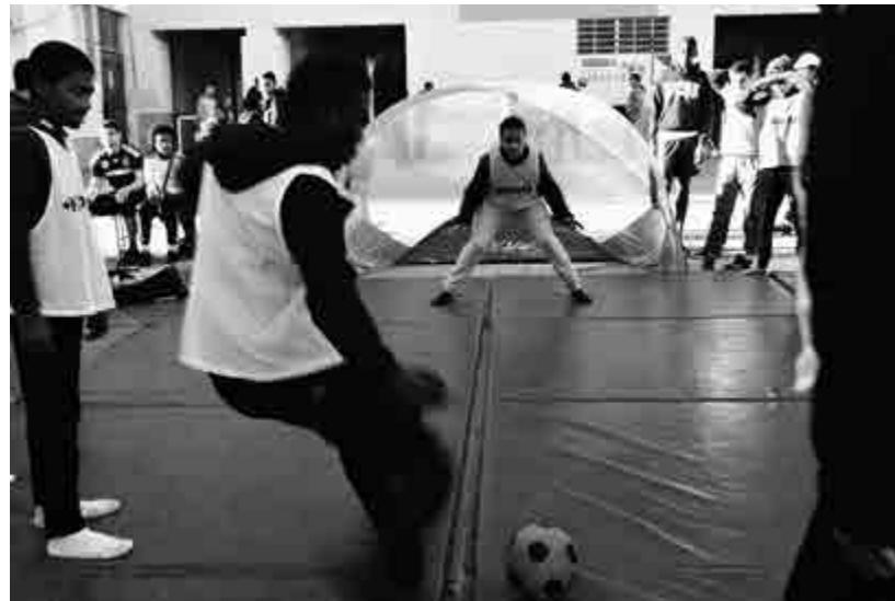
Animation sur le plateau sportif du quartier des Moulins, Nice.

J.-M. D. : Nous bénéficions de plusieurs soutiens publics importants 3 . Pour notre principale intervention, l'animation des plateaux aux Moulins pendant les vacances, nous intervenons en partenariat avec l'Association départementale de la sauvegarde de l'enfance à l'adulte (Adsea 06) et le service de Prévention spécialisée. L'équipe est composée des deux éducateurs sportifs de Prévention Éducation Sport, de deux