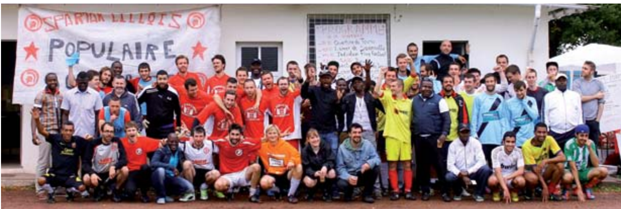
Au-delà du football, le Spartak lillois s'est ouvert à d'autres disciplines sportives.

Même si les « Spartakistes » qui le souhaitent peuvent s'adonner à la compétition (l'association compte par