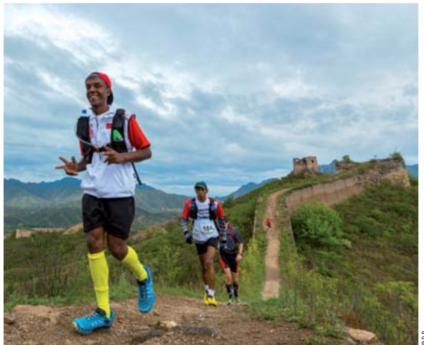
En mai 2015, un défi pour sept coureurs : réaliser le trail de la Muraille de Chine.

généraliste, un médecin du travail, un entraîneur de club d'athlétisme, un responsable de ressources humaines, etc. Principal levier de la motivation des personnes handicapées que nous accompagnons : la participation à un grand trail à l'étranger. En 2013, six ont participé à l'Ultra Trail Atlas Toubkal, dans le Haut-Atlas marocain. En 2014, le point fort a été le Dodo Trail à l'île Maurice, en juillet, et le Trail de l'île de Rodrigues, en novembre. Sur ces événements, aucun coureur du groupe n'a été en échec ; ils sont tous allés au bout du défi et chacun est revenu avec une médaille. C'est inestimable pour prendre confiance en soi.