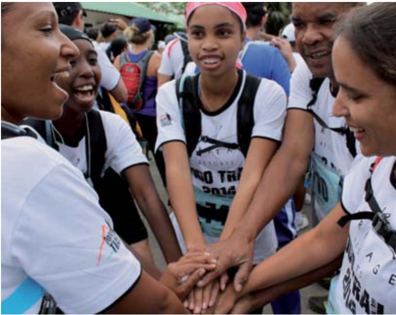
Les Albusiens sur le Dodo-Trail à l'Île-Maurice, juillet 2014.