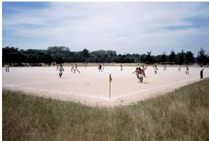
Un dimanche matin au bois de Vincennes. Joueurs de football.

Cependant, on constate que l'essentiel des mesures préconisées dans cette littérature relève d'actions et de décisions politiques au niveau local ou au niveau national. Les recommandations insistent sur la nécessité de l'affirmation d'une volonté politique clairement affichée pour engager un véritable programme national « activité physique et santé ». De nouveaux partenariats doivent également être