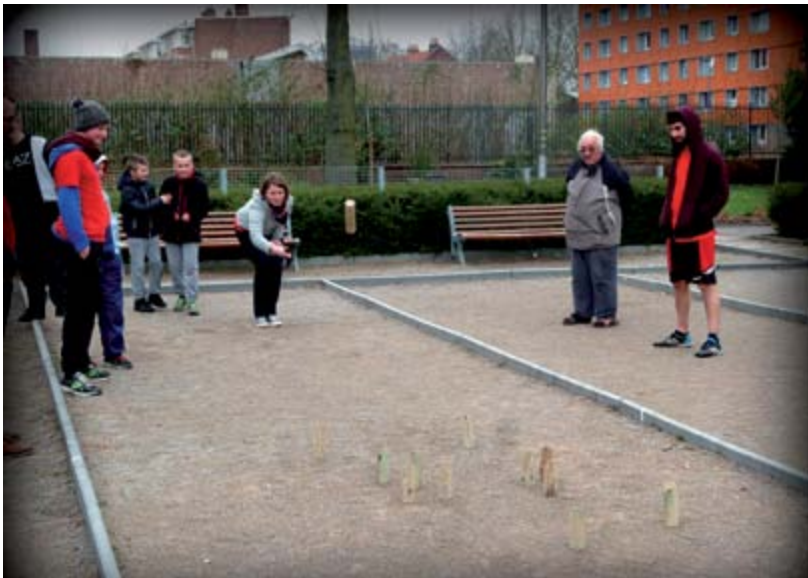
Activité de mólkky organisée dans le cadre du festi-santé.

« L'OBJECTIF DE L'ASSOCIATION : DÉVELOPPER UN SPORT ACCESSIBLE À CHACUN, QUELS QUE SOIENT SON ÂGE, SON NIVEAU DE PRATIQUE OU SES REVENUS. »