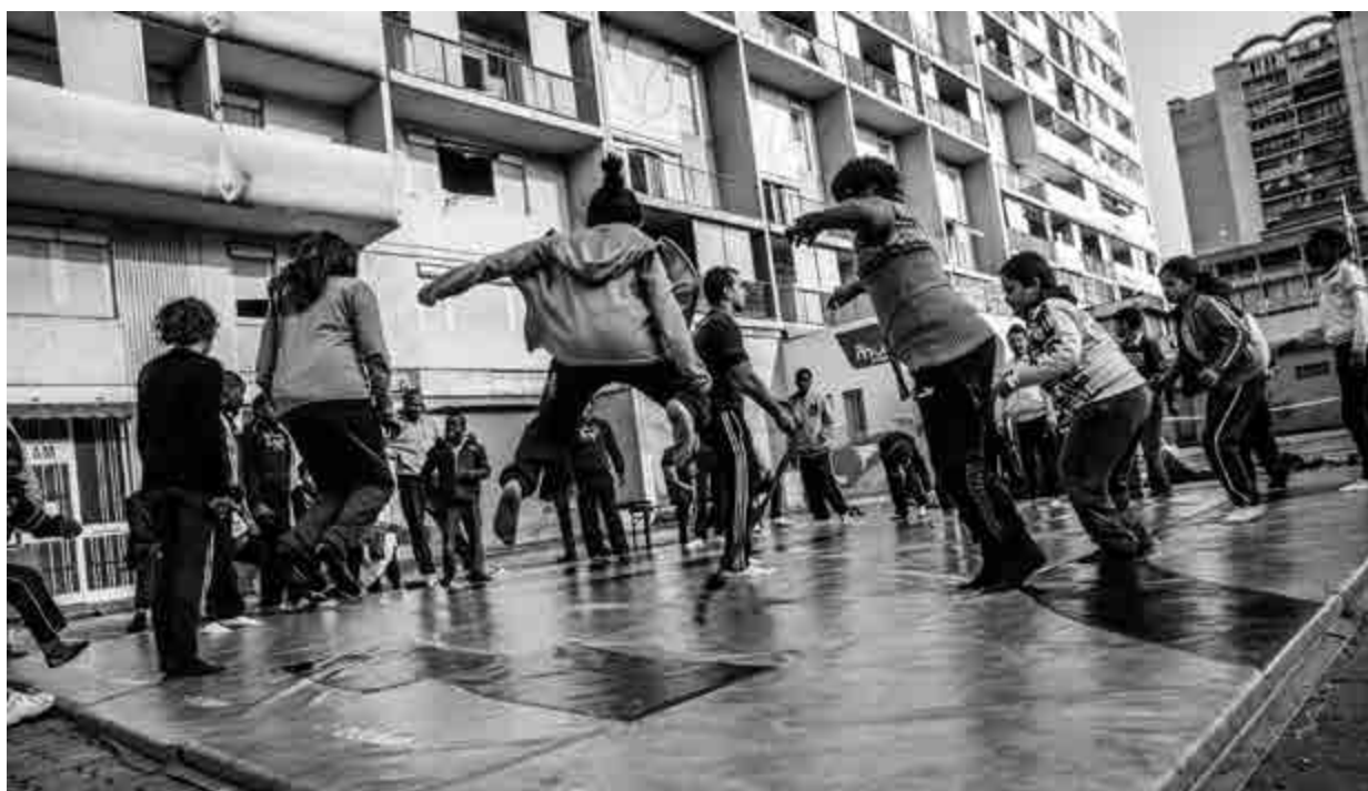
Animation sur le plateau sportif du quartier des Moulins, Nice.

A. V. : La principale explication avancée par les adultes est le manque de disponibilité; ils expriment une difficulté à intégrer une activité physique dans leur emploi du temps. L'intensité