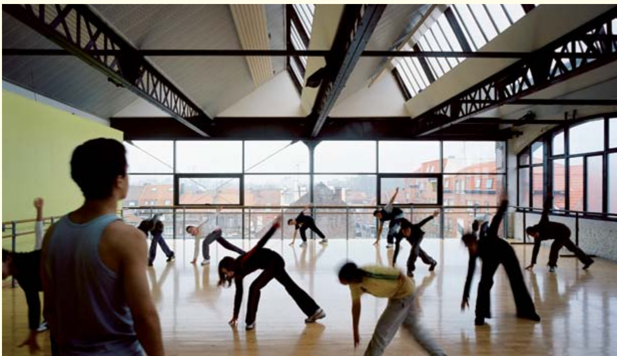
Roubaix : l'ancienne usine Roussel réhabilitée en école de danse hip-hop – Lille Métropole Communauté urbaine.