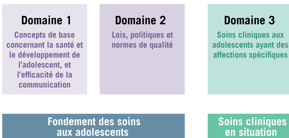
Figure 2. Trois domaines en rapport avec les soins de santé prodigués aux adolescents

qu'elles puissent être, comme beaucoup d'autres, particulièrement liées à la santé et au développement de l'adolescent. Il est présumé que de telles compétences sont traitées en relation avec d'autres activités éducatives. Le Tableau 1 comprend la liste des domaines et des compétences en matière de santé et de développement de l'adolescent.