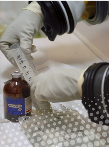
Préparation d'une chimiothérapie

Les médicaments ne sont pas préparés à l'avance, mais au début de chaque séance. Chaque préparation est destinée à un patient en particulier. Elle nécessite un temps de réalisation bien précis que l'on ne peut pas réduire, cela explique l'attente parfois longue avant que les médicaments de chimiothérapie soient administrés.