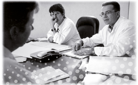
La décision pluridisciplinaire

L'ordre des traitements du cancer est défini par l'équipe médicale pluridisciplinaire en fonction du stade de la maladie et de l'état général du patient.