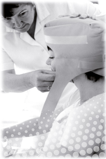
Pose d'un casque réfrigérant