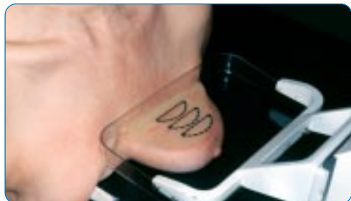
Une mammographie de face

femmes, mais cela ne dure que quelques secondes. La pression du sein est limitée par un mécanisme de sécurité.